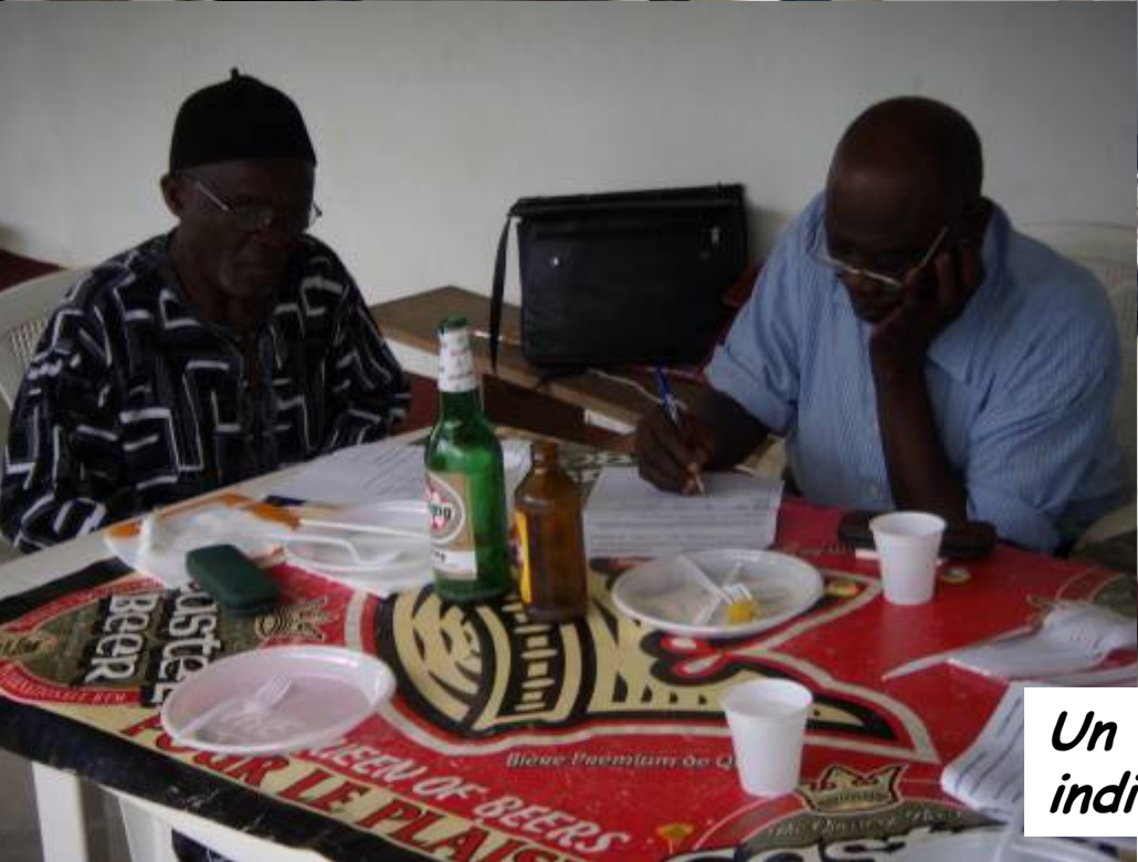
Un exercice qui ne laisse personne indifférent