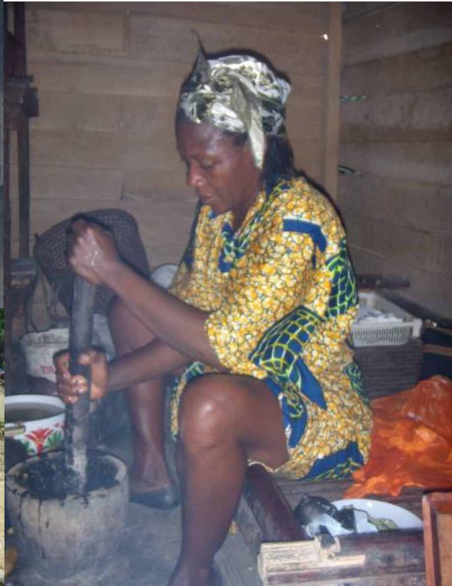
3 modes de préparation : bouilli, frit ou pilé