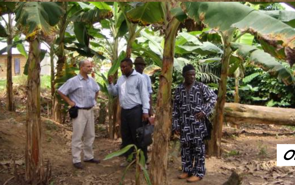
Observateurs du processus