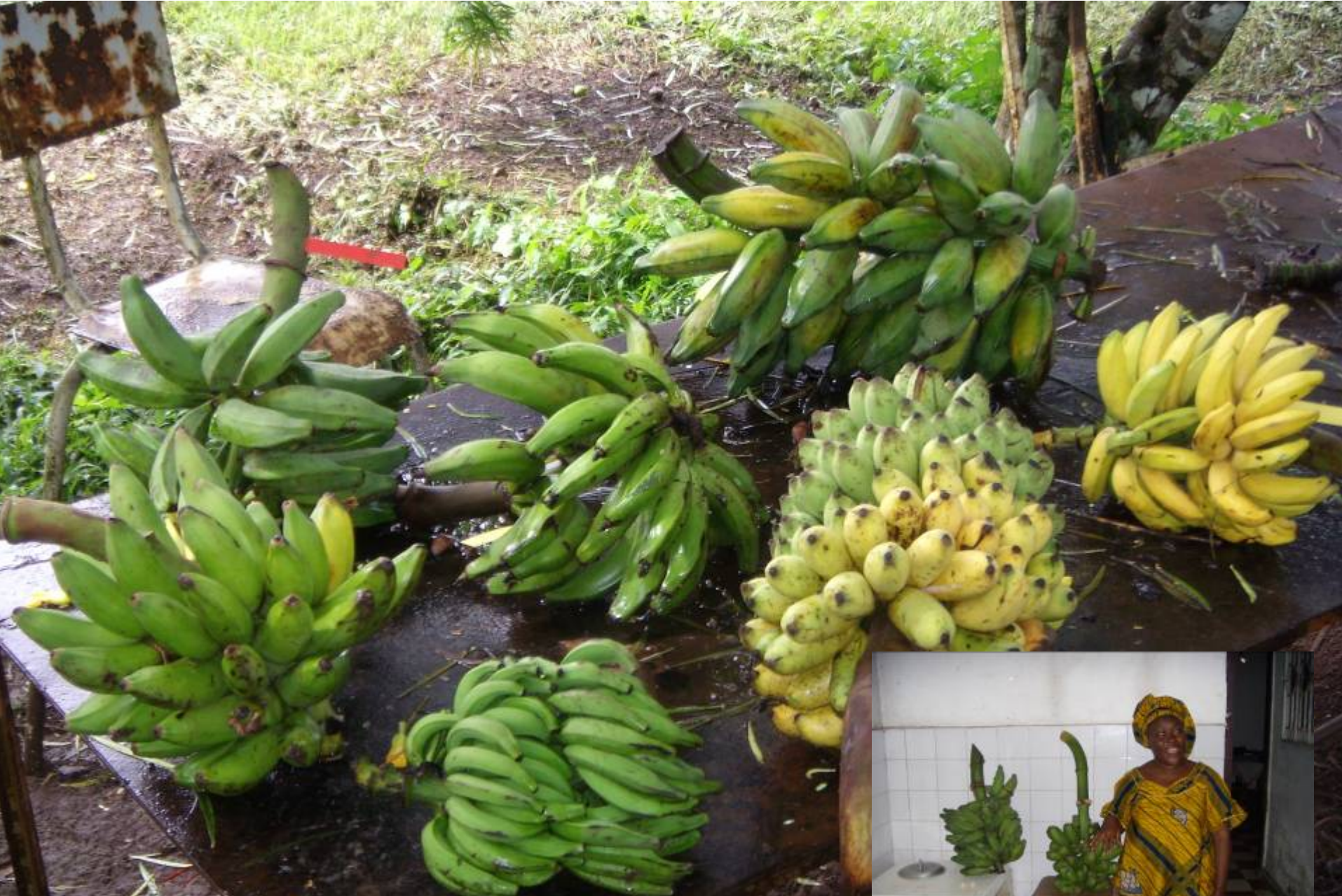
Au départ, les régimes à des maturités diverses