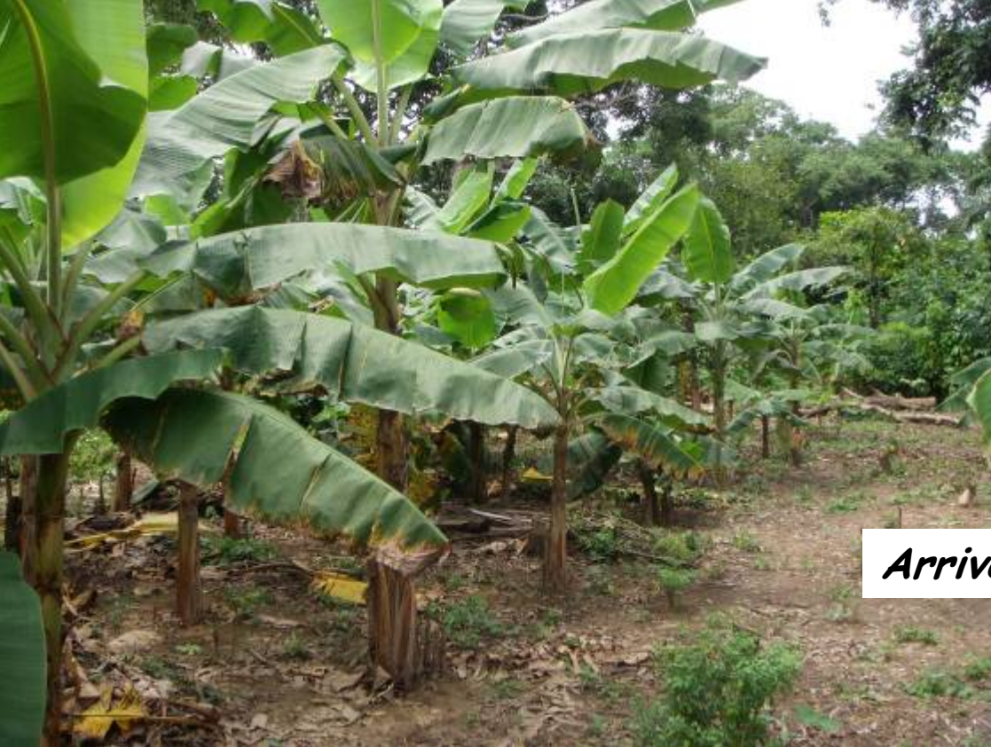
Arrivée sur la PCR de Kombé