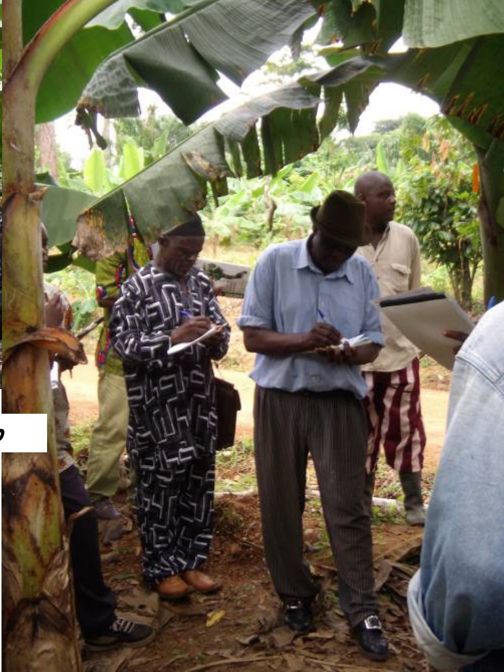
Evaluation au champ