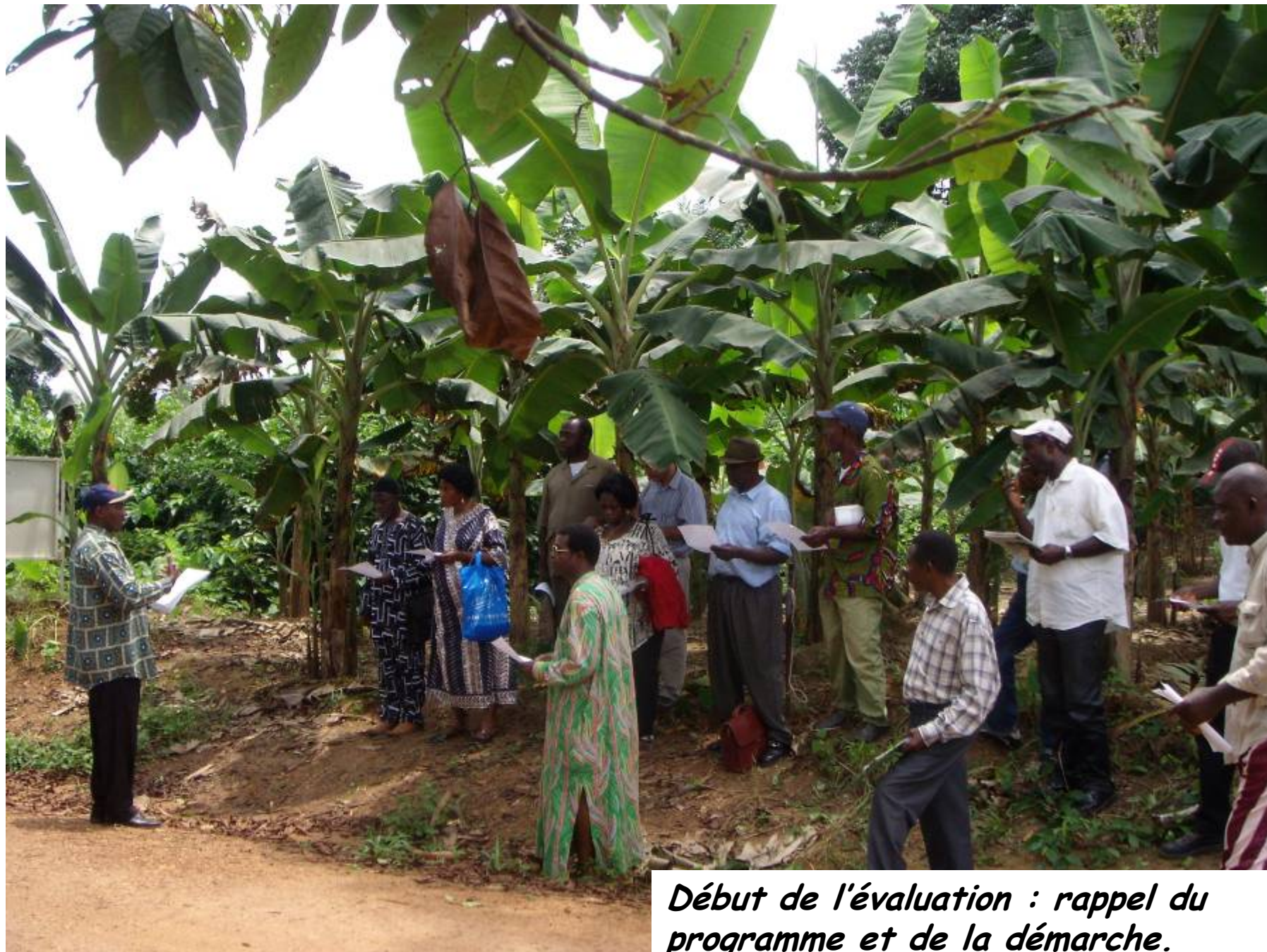
Début de l'évaluation : rappel du programme et de la démarche.